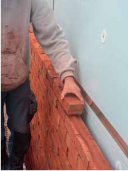
De bouwvakkers van Bouwbedrijf Degraeve leggen de stenen mooi met de rechte achterkant tegen de koord. Alleen hangt die koord hier aan de 'binnenkant' van de spouw en niet aan de buitenkant.